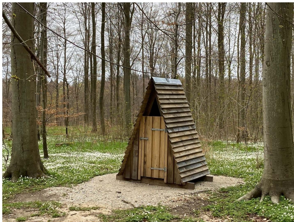
Billede 2. Primitivt toilet i landskabet samt det fulde udtryk