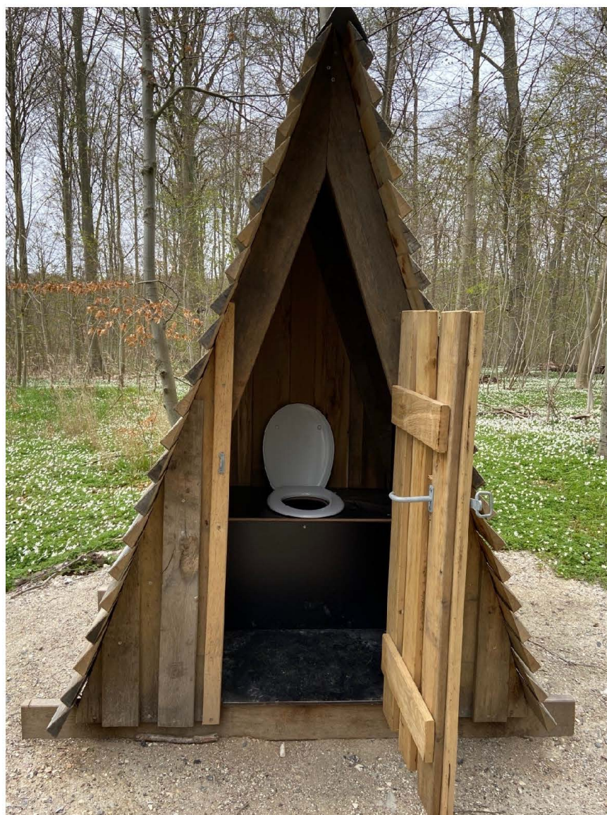
Billede 1. primitivt toilet indefra