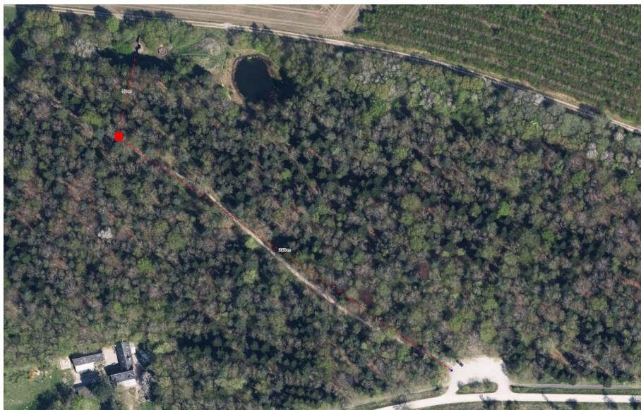
Billede 2. Placering af primitivt toilet ved Kroppedal Vestskoven. Toilettet placeres ved kørefast vej ca. 50 m. væk fra shelterpladsen. Der er ca. 250 m. til en vendeplads i forbindelse med udtømning.